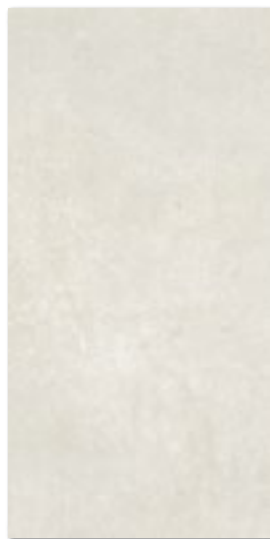
1863-000 Warm Mink 10M