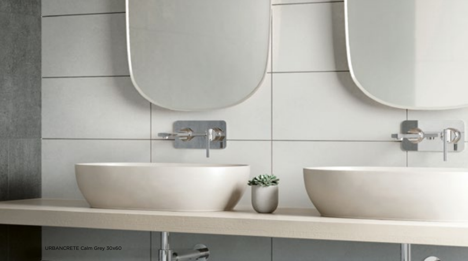
URBANCRETE Calm Grey 30x60