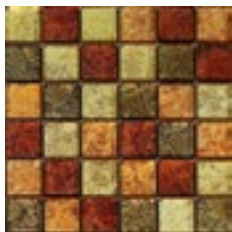
1838-0002 72M Brown & Yellow