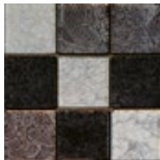
1838-0003 72M Black & White