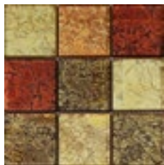
1838-0004 72M Brown & Yellow