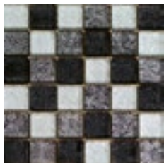
1838-0001 72M Black & White