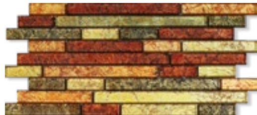
1838-0007 Brown & Yellow 72M