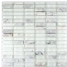
1838-0023 Stick White Mix 68M