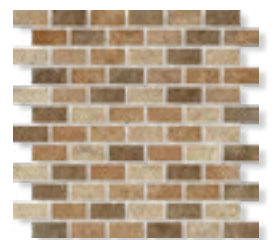
1803-0021 Curry Mosaico Brick