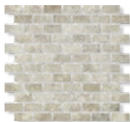
1803-0019 Ginepro Mosaico Brick