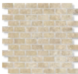
1803-0018 Zenzero Mosaico Brick