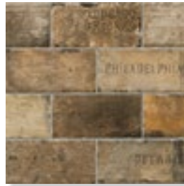
1021-0006 State Street 29M