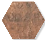
1021-0009 Old Chicago 33M