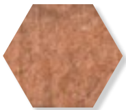
1021-0012 Wrigley Red 33M