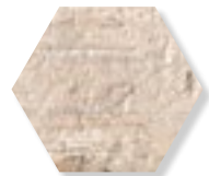
1021-0022 South Side 33M