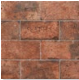
(100x200) 1021-0008 Wrigley Red 29M