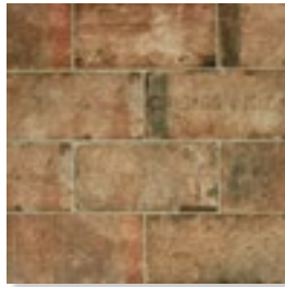
1021-0001 Old Chicago 26M 1021-0013 Old Chicago 26M 1021-0017 Old Chicago 26M