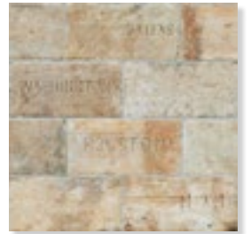
1021-0004 South Side 29M