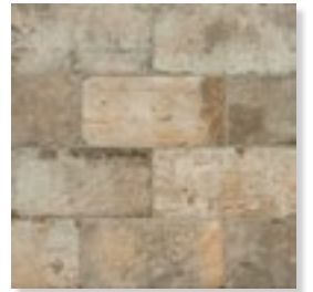
1021-0003 South Side 26M 1021-0014 South Side 26M 1021-0018 South Side 26M

56 forskellige mønstre & 10 forskellige overflader = 560 forskellige udtryk. Format 100x200 mm har 5-7%/m 2 "Chicago" præget i flisen