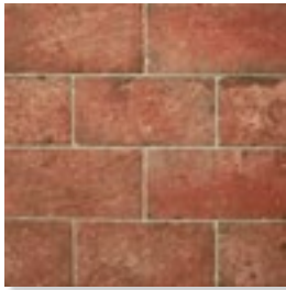
(100x200) 1021-0007 Wrigley Red 26M (200x200) 1021-0016 Wrigley Red 26M (200x400) 1021-0020 Wrigley Red 26M

100x200x10,5 mm, 200x200x10,5 mm og 200x400x10,5 mm