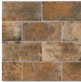
1021-0002 Old Chicago 29M