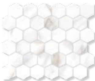
1823-0009 Calacatta Oro