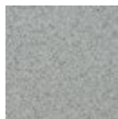
Dotti Light Grey R10A 1869-0027 12M