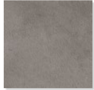
1012-0062 Grafite 38M Grip R11 A+B+C