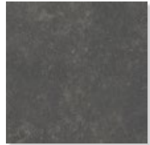
1012-0128 Darkstone 38M Grip R10 A+B