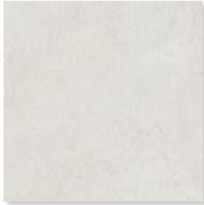
1012-0021 Limestone Bianco 38M Grip R11 A+B+C