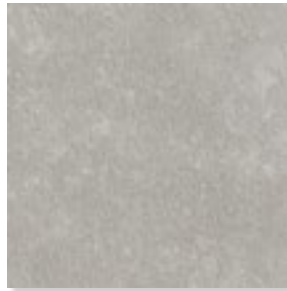
1012-0104 Lightstone 38M Grip R10 A+B